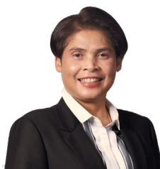
นางสาววาริ แวนแก้ว รองอธิบดีกรมบัญชีกลาง