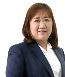
นางสุธิษา จารุเมธาวิทย์ รองอธิบดีกรมบัญชีกลาง